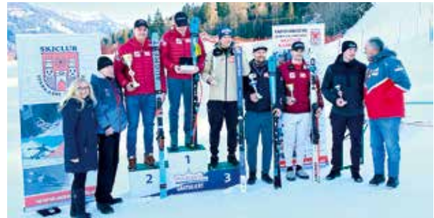
FIS-Super G um das Stadtwappen Herren