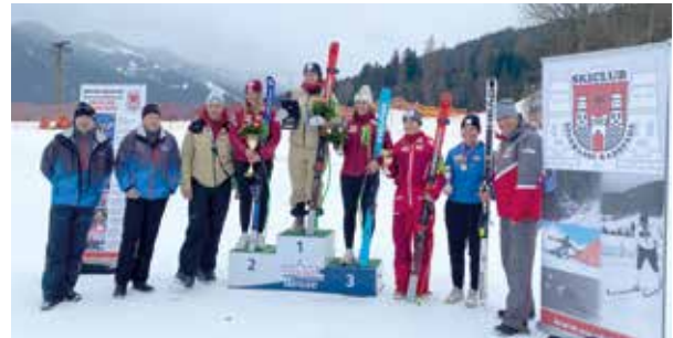
FIS-SG um das Stadtwappen Damen