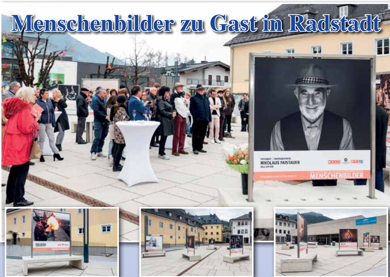
Die Ausstellung „Menschenbilder“ zeigt 30 beeindruckende Werke von Salzburger Fotografen.

Bilder von der Schau in Zell am See.