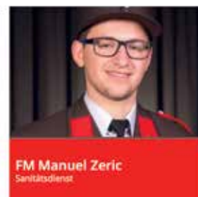
FM Manuel Zeric Sanitätsdienst

und Tiefen, Personen in Gefahrenbereichen wie Schadstoffaustritt, Gebäudeeinsturz, etc.). Die Feuerwehr, welche aufgrund ihrer Ausbildung und technischer Ausrüstung an vorderster Front für die Rettung verletzter