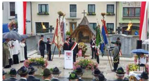
Aufstellung der Vereine am Kriegerdenkmal