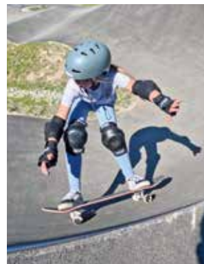
Sommertraining – Skaten

Dieses Motto motivierte viele Teilnehmer gemeinsam möglichst viele Kilometer laufend oder wärend auf einer 4,7 km langen Runde, ausgehend vom Fußballplatz in Radstadt bis zum Wendepunkt Krallinger in Altenmarkt, für den guten Zweck zurückzulegen. Die Startgelder flossen zur Gänze in die Forschung zur Heilung von Querschnittlähmung. Radstadt war zum ersten Mal offizielle Location für diese weltweite Laufveranstaltung. Alle Teilnehmer waren mit großer Begeisterung dabei und waren extrem stolz über jeden zurückgelegten Kilometer, welcher zugunsten der Rückenmarksforschung gelaufen wurde. Organisiert wurde diese Veranstaltung vom Verein Tri Alpin Radstadt. Nachdem diese Initiative zur gemeinsamen Bewegung so gut angenommen wurde, laufen bereits die Vorbereitungen für den Wings for Life Run am 04.05.2025. Der Veranstalter bedankt sich bei allen Teilnehmern für dieses Gänsehautgefühl beim Start und für die tolle Stimmung. "Dankeschön an den Fußballclub Radstadt zur Verfügungstellung des Vereinshauses"